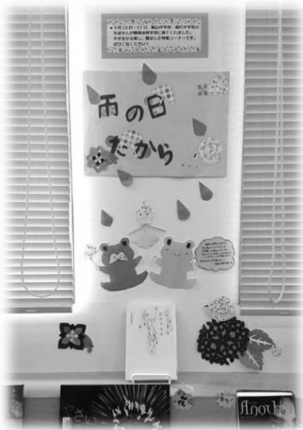
↑ 完成した特設コーナーの様子★

竜爪中・観山中のみなさん、三日間お疲れ様でした (^ ^ ) 図書館での職場体験学習は、各学校を通して申し込むことができます。 みなさんのご来館、お待ちしております (^ ~ ^ ) ♪