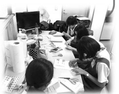
フィルムコート掛け体験の様子★ →

竜爪中・観山中のみなさん、三日間お疲れ様でした (^ ^ ) 図書館での職場体験学習は、各学校を通して申し込むことができます。 みなさんのご来館、お待ちしております (^ ~ ^ ) ♪