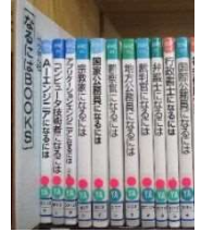
就活ロングセラー「なるには」シリーズ。 図書館 YA サービス必携アイテムです☆