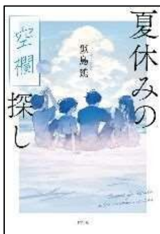
『夏休みの空欄探し』 似鳥 鶏/著 ポプラ社

高校2年の成田頼伸は、夏休みだというのに予定もなく1日が過ぎ、これでいいのだろうかと自問自答を繰り返していた。