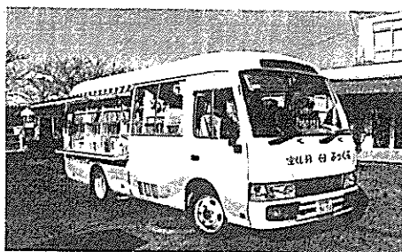
移動図書館車「ぶっくる」