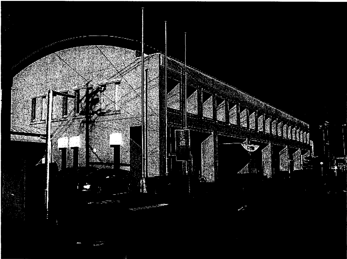
静岡市立西奈図書館