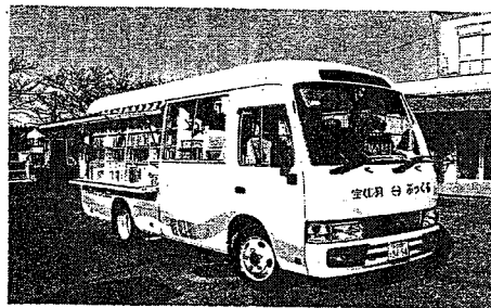
移動図書館車「ふっくる」