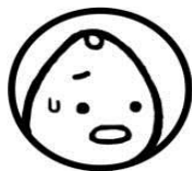
こま太 た くん

こまったなー。はかせ、公園 こうえん でいっぱいどんぐりを拾 ひろ ってきたんだけど、どうしよう？