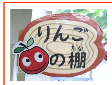
南部図書館 「りんごの棚」より

「読書バリアフリー法」についてご存じでしょうか？ 障害の有無にかかわらず、すべての人が読書による文字・活字文化の恩恵を受けられるようにするための法律で、令和元年6月に施行されました。南部図書館では、子どもからお年寄りまでだれもが利用できる図書館をめざして、昨年、子ども向けのバリアフリーな本を集めた「りんごの棚」を新設しました。点字のついた絵本や大きな活字の読み物、LLブックなど、スウェーデン発祥のこの棚は、子どもだけでなく多くの方に利用され、静岡市立図書館で広がりを見せています。