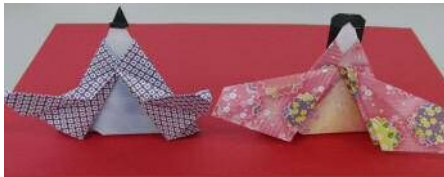
『おりがみ四季折々』日本放送出版協会