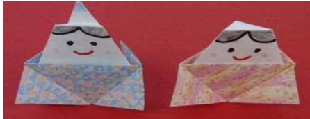
『つくってかざろう!きせつのおりがみ!』学研

3月3日はひなまつり。やっと寒さが遠のき、春の息吹を感じるようになりました。雛壇を飾って、子どもの健やかな成長を喜び、幸せを願うご家庭も多いと思います。今回は、折り紙でお雛様を作ってみました。(分類はすべて754.9紙工芸です)