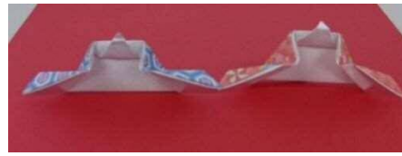
『おりがみの散歩道』生活ジャーナル