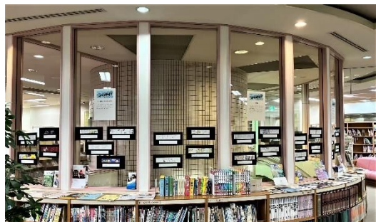
長田図書館の展示の様子

10月29日には入賞者への表彰式が行われました。始まるまでは緊張感がありましたが、式が始まると和やかなムードに。皆さんありがとうございました!!