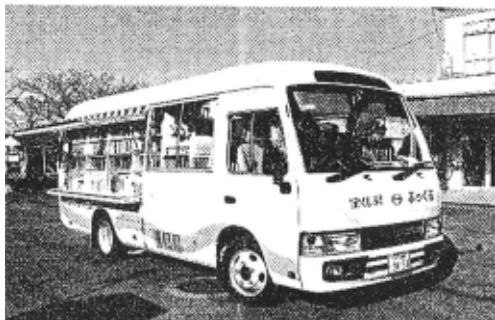
移動図書館車「ふっくる」

市立図書館12館間を2台の連絡車が運行し資料を配送しています。連絡車の運行により12館どこでも予約の受け取り、他館資料の返却が可能となっています。