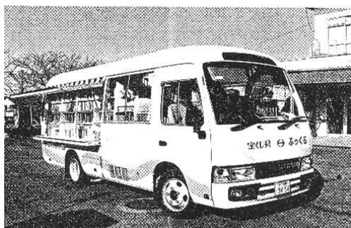
移動図書館車「ふっくる」

市立図書館12館間を2台の連絡車が運行し資料を配送しています。連絡車の運行により12館どこでも予約の受け取り、他館資料の返却が可能となっています。