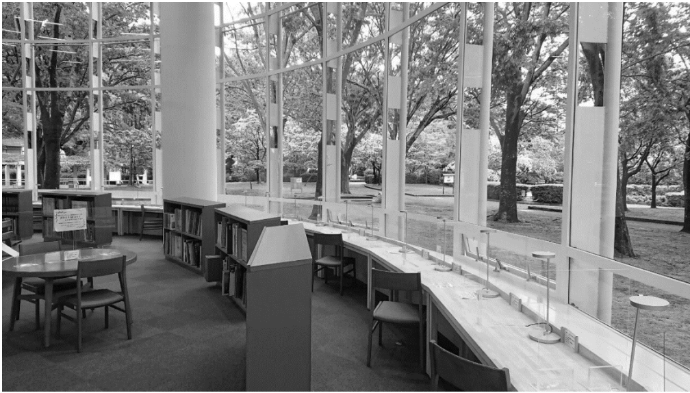
静岡市立中央図書館 1F 読書席（令和3年リニューアルオープン後）