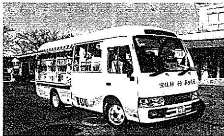
移動図書館がぶっくる!