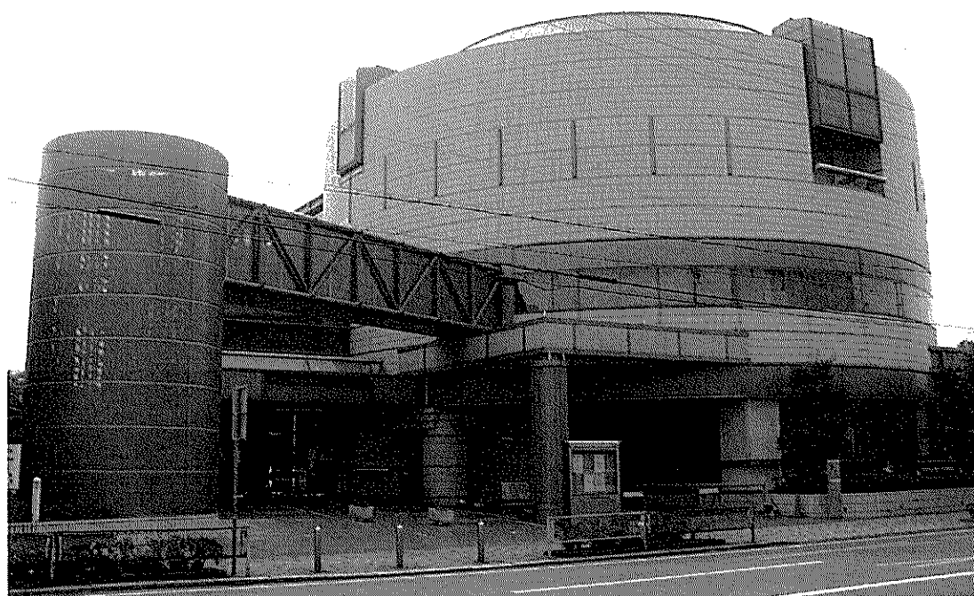
静岡市立清水中央図書館