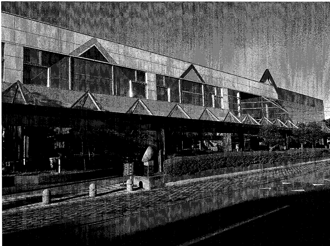
静岡市立南部図書館