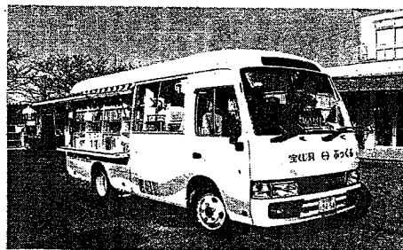
移動図書館車「ぶっくる」